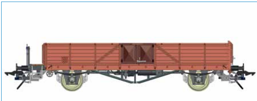
Omm 32 (Linz), mit Bremserbühne, DB - Art. Nr. 42131-01