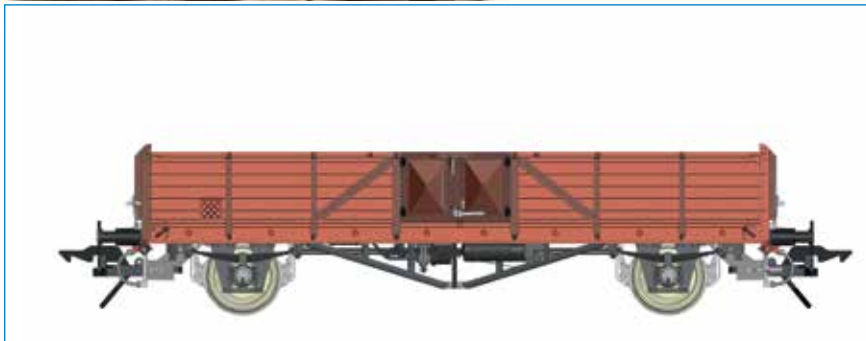
Omm 32 (Linz), DB - Art. Nr. 42130-01