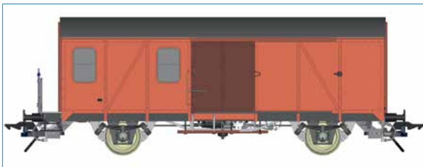
Pwghs 54 Güterzuggepäckwagen, mit Fenster, DB - Art. Nr. 42238-01