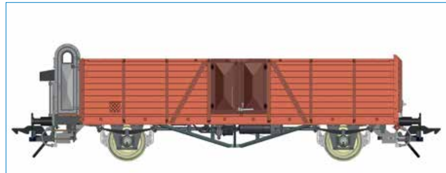
Omm 33 (Villach) mit Bremserhaus, DB - Art. Nr. 42134-01