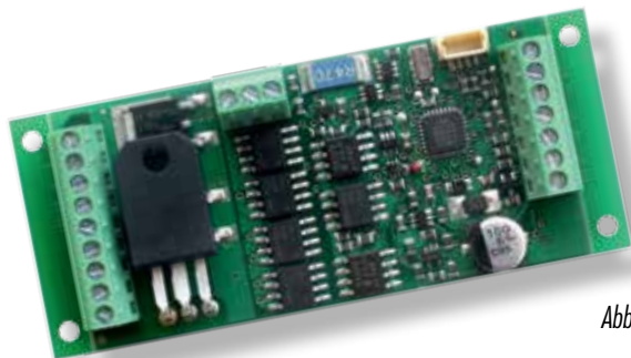
GOLD maxi Art. Nr. 10440

Der bekannte GOLD maxi Decoder wird ab diesem Jahr mit einer neuen Software-Generation ausgeliefert, in der die aus der „plus“-Serie bekannten Features implementiert sind. Die Hardware des Decoder bleibt dabei unverändert. Bereits vorhandene GOLD maxi - Decoder können mit dem Digital plus Decoderprogrammer (Art. Nr. 23171) und der kostenlosen Software „CV-Editor“ nachträglich mit dieser neuen Software ausgerüstet werden, natürlich auch im eingebauten Zustand.