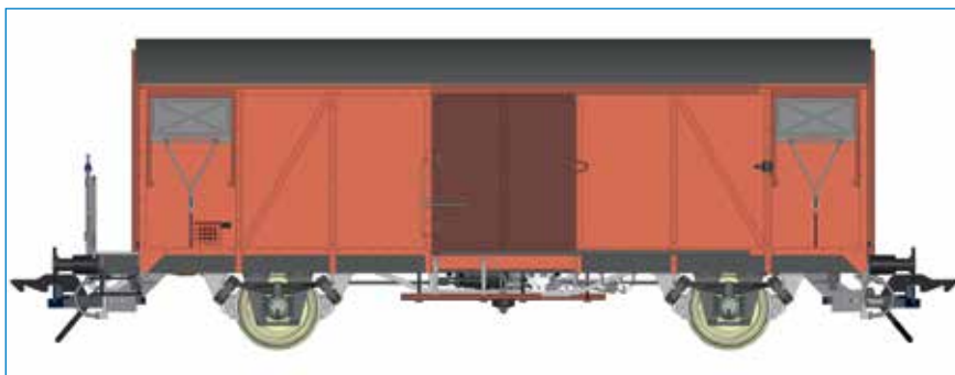
Gms 54 Gedeckter Güterwagen mit Bremserbühne, DB - Art. Nr. 42235-01