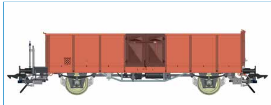
Omm 42 mit Bremserbühne - DB - Art. Nr. 42137-01