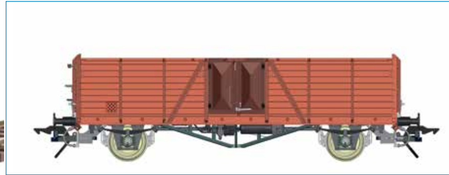
Omm 33, (Villach), DB - Art. Nr. 42133-01